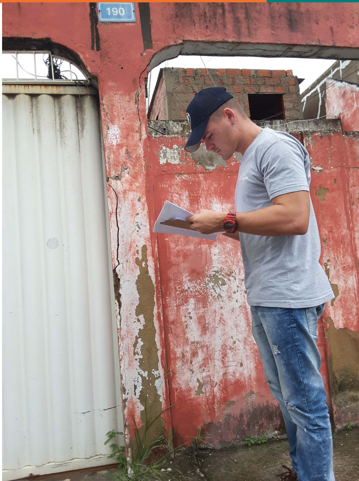
Figura 2- Registro fotográfico da equipe da Synergia no endereço informado pela manifestante.