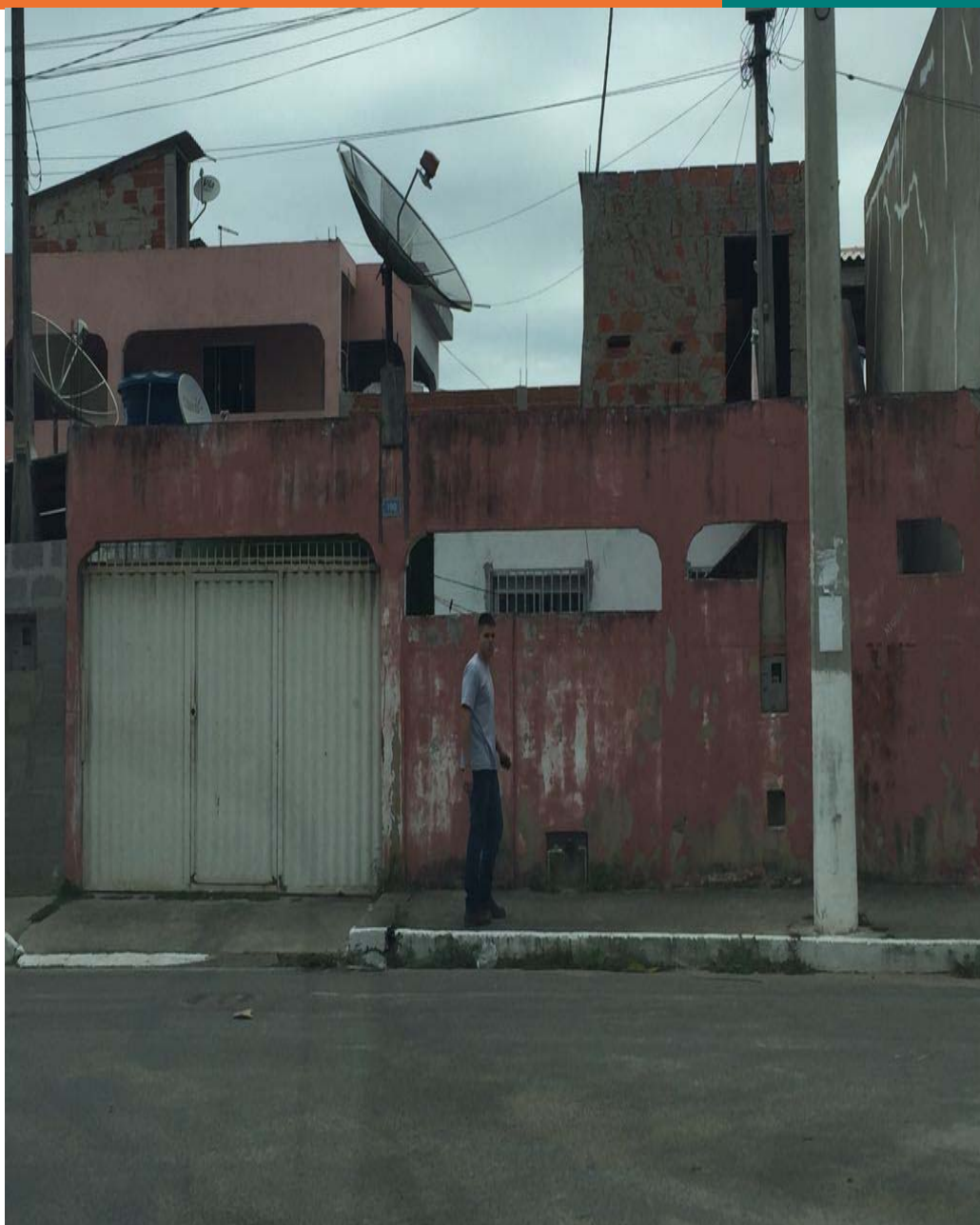
Figura 1-. Registro fotográfico da equipe da Synergia no endereço informado pelo manifestante.